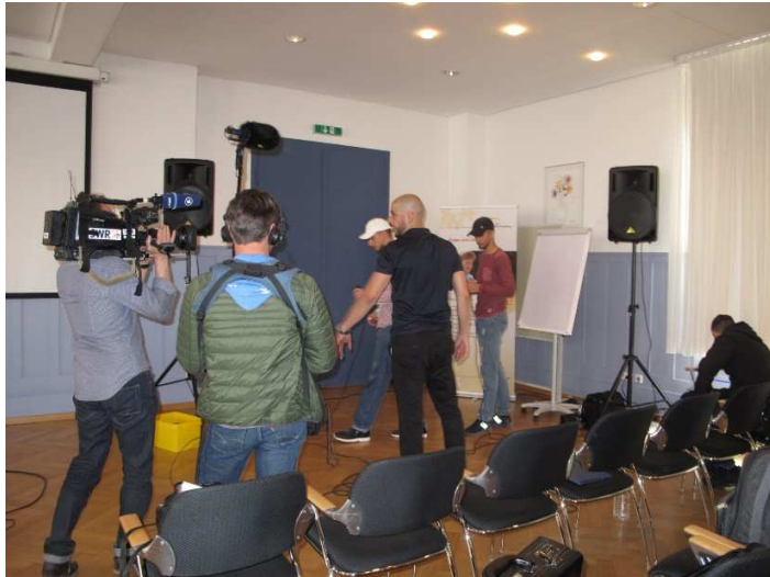
Jugendliche Rapper beim soundcheck unter medialer Aufmerksamkeit

Für die musikalische Umrahmung der Jahresversammlung sorgten Jugendliche, die ihr in der U-Haft in der Vollzugsanstalt Stuttgart-Stammheim erworbenes Können vor einem Publikum zeigten, dem sie bisher in einer anderen Rolle begegnet waren. Dafür ernteten sie Applaus und mediale Aufmerksamkeit. Fernsehbericht in SWR Aktuell: Zum Beitrag